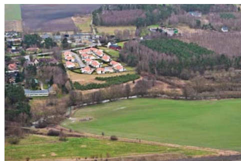
Det halvöppna landskapets mosikartade karaktär.