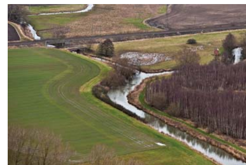
Saxån där järnvägen korsar.